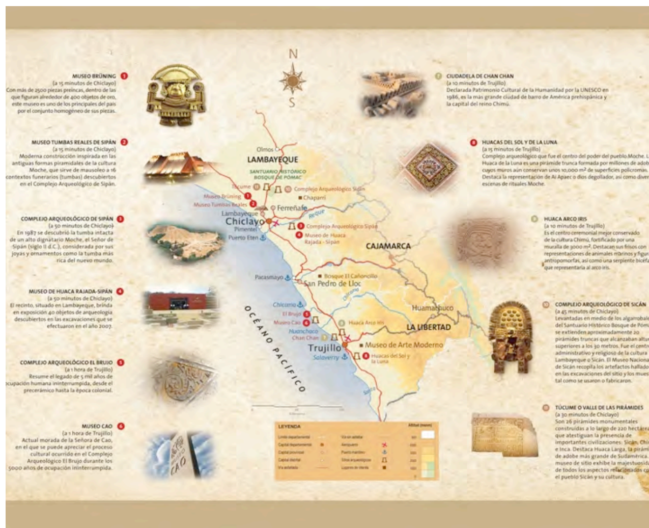
Cuadro 2. Patrimonio Arqueológico en Moche

La Ruta Moche muestra el avance que se ha dado en las estrategias de valorización de la identidad cultural (IC). La arqueología ha dejado de ser solo científica y ha pasado a ser tema de agenda pública, involucrando a autoridades nacionales, regionales y locales, y a una gran diversidad de actores privados (Hernández, 2010).